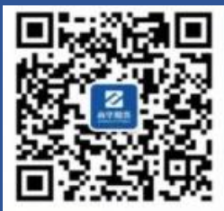
南华期货微信公众号