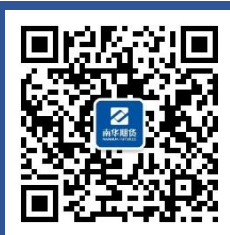
南华黑色投研札记